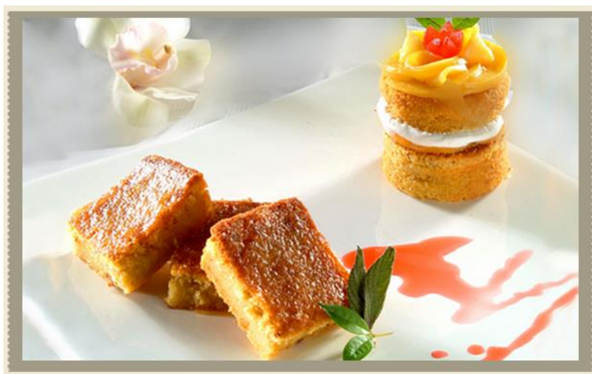
Figura 1. Torta de plátano

Opciones como la torta de maduro, jugos naturales, sánduche de atún, frutas frescas, todos ellos elaborados sin el complemento de grasas saturadas, formarían parte del menú semanal de oferta en los bares estudiantiles; su rico sabor permite que muchas de ellas se posicionen en el gusto de los estudiante, reemplazando por completo las papas fritas, grasas saturadas, hamburguesas que actualmente son el plato preferido en los recreos.