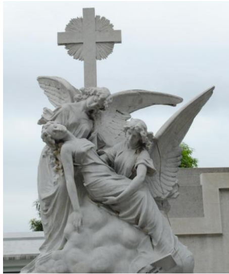
Figura # 3. Tumba familia Avilés y Avilés

Fuente: Obra de Pietro Capurro del Cementerio Patrimonial de la Junta de Beneficencia de Guayaquil