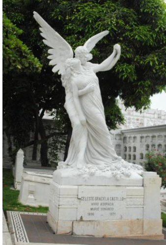
Figura # 1. Sarcófago de Celeste Castillo, Beso del Ángel

A continuación se realiza la decodificación artística y literaria de esculturas de acuerdo al estilo.