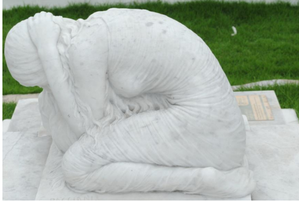
Figura # 6. Tumba familia Unamuno

significa verdad, la figura se muestra tal cual es (Zeballos, M., 2016, Comunicación personal).