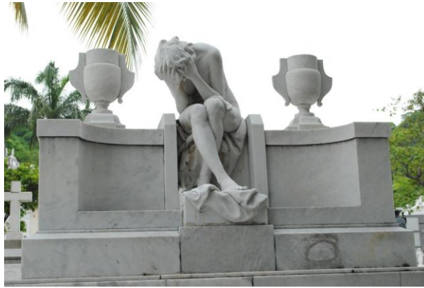
Figura# 5. Tumba familia Mendoza, Desolación

Fuente: Obra de Enrico Pacciani del Cementerio Patrimonial de la Junta de Beneficencia de Guayaquil