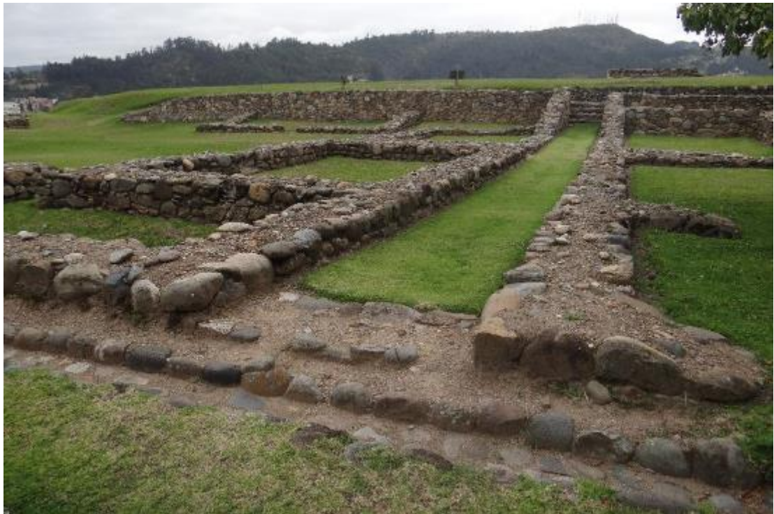
Figura #3: Vestigios en el Parque Arqueológico Pumapungo