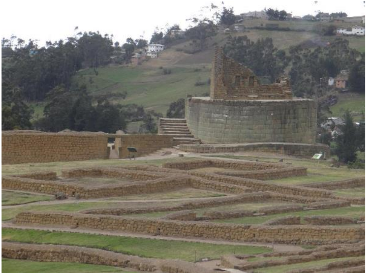
Figura #6: Templo del Sol en Ingapirca