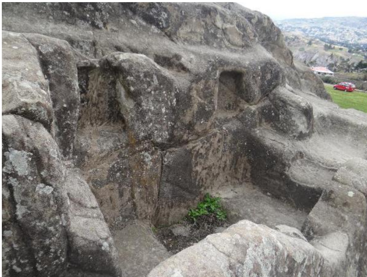
Figura #5: Vestigios Baños del Inca