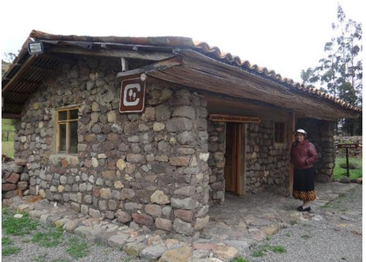
Figura #9: Guía de la comunidad de Sisid-Anejo junto al Centro de Interpretación en Coyoctor