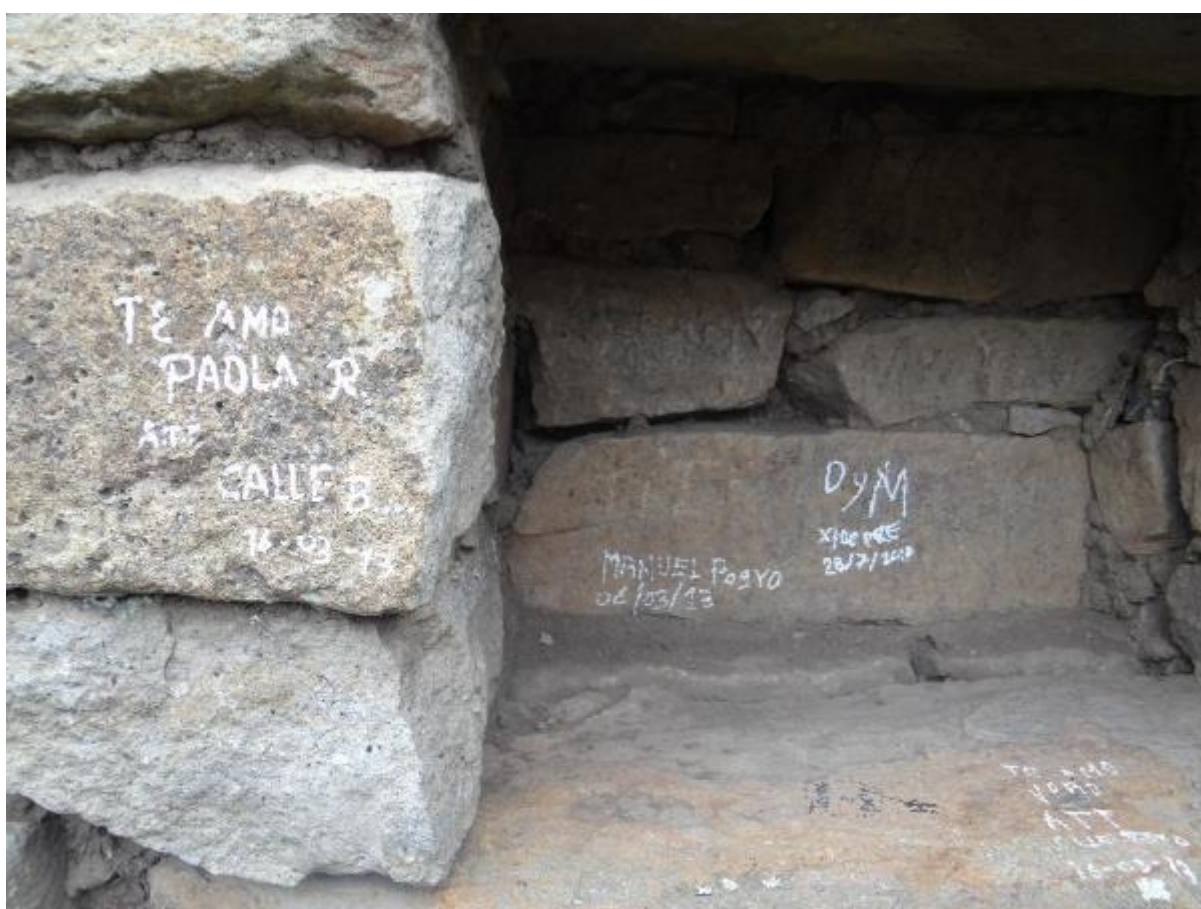
Figura #8: Vandalismo con grafitis en vestigios de Cojitambo