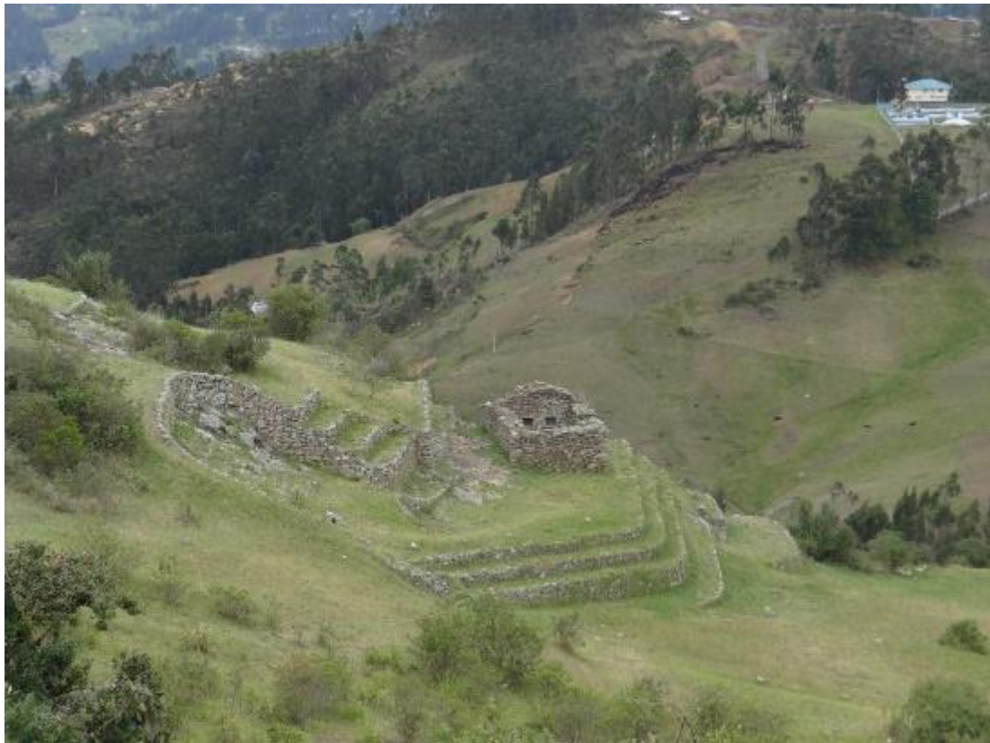
Figura #4: Vista panorámica del Complejo Arqueológico Cojitambo

de Cañar. Según los historiadores este lugar fue el depósito de oro de Atahualpa, en donde se encuentra el primer templo de los Cañaris que con el pasar del tiempo hubo asentamientos incas. Cojitambo fue un centro religioso, político, y administrativo para los Cañaris e Incas. Las estructuras de Cojitambo son de construcción sólida teniendo como base la roca arenisca. Este complejo hace dos años fue declarado patrimonio por la UNESCO, anteriormente estaba abandonado por su falta de accesibilidad, por lo que no era conveniente para el desarrollo del turismo, actualmente existe una vía de acceso terrestre para poder ingresar al complejo. La Junta Parroquial de Cojitambo y la Municipalidad de Azogues son los encargados de la gestión de este sitio.