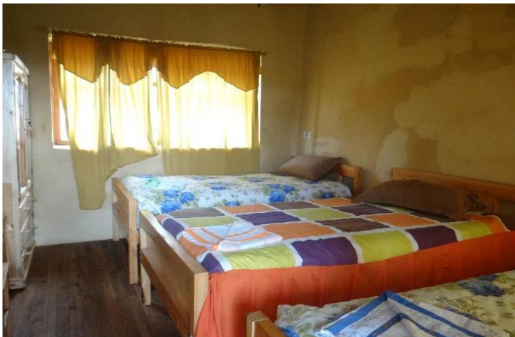
Figura #12: Interior de una habitación triple en Hostal Comunitario Sisid-Anejo