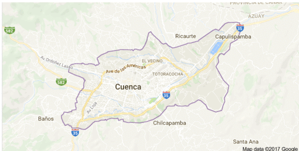
Figura #1: Mapa de la ciudad de Cuenca

El 1 de diciembre de 1999, la UNESCO reconoció a la ciudad de Cuenca como Patrimonio Cultural de la Humanidad, por la conservación de su Centro Histórico desde su fundación en 1557, lo cual se ve reflejada en su arquitectura y cultura en general, entre sus atractivos turísticos se encuentran la Catedral de la Inmaculada Concepción de Cuenca, Museo Pumapungo, Parque Nacional El Cajas, Catedral vieja de Cuenca, Museo Remigio Crespo Toral, entre otros (Instituto Nacional de Patrimonio Cultural, 2017).