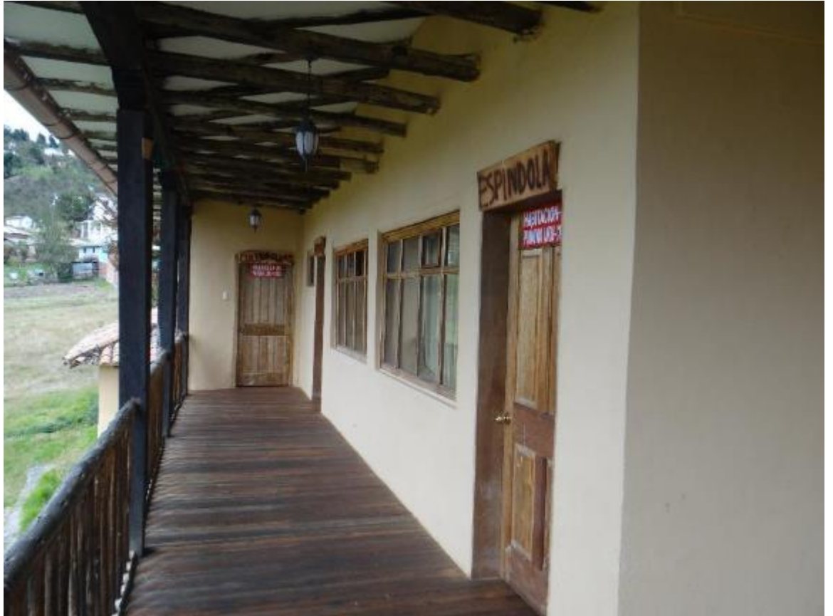
Figura #7: Parte del Hostal Comunitario en Sisid-Anejo

Actividades complementarias: La muestra de artesanías, Maki Fairtrade es cien por ciento elaborada por los habitantes de la comunidad, aunque muchas veces las compras de materiales se hacen en la provincia del Guayas, porque es menos costoso y resulta conveniente para la comunidad. Al momento del almuerzo, se ofrece la Pampamesa que es un plato típico de las comunidades andinas, que está compuesta de alimentos cosechados tales como: papa, haba, chocho, maíz, quinua, melloco, trigo, zanahoria blanca, la oca y otros alimentos de producción agrícola que más allá de ser un plato típico, representa la cocina ancestral y la conservación de esta tradición indígena. El tour también cuenta con clases básicas de quichua a los turistas para conocer un poco sobre el idioma