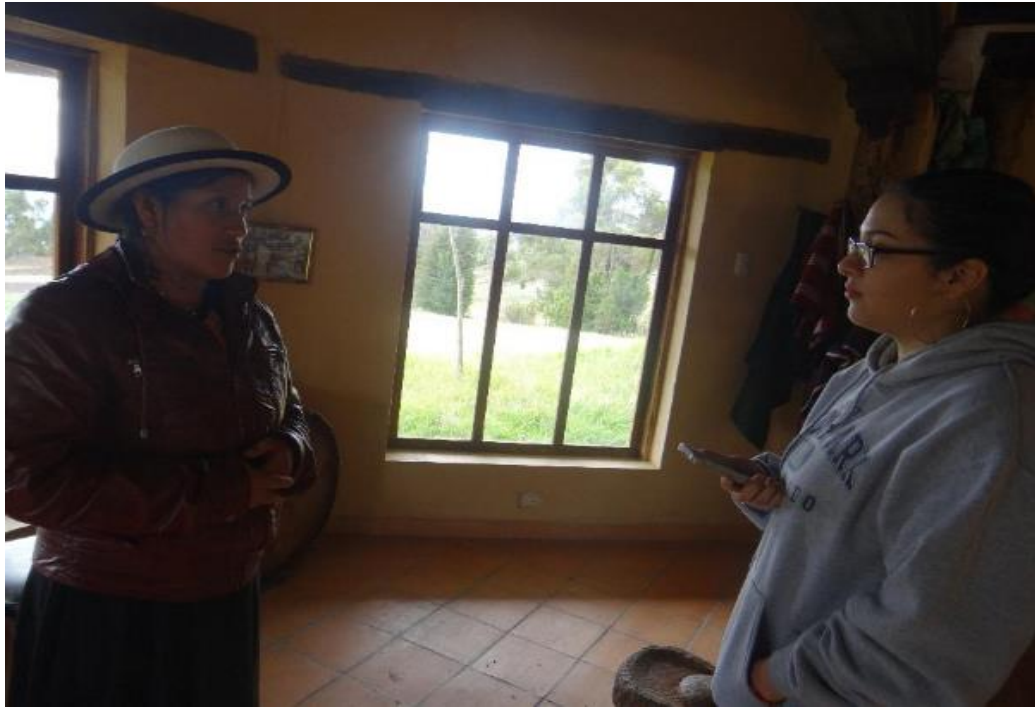
Figura #11: Guianza sobre historia de la comunidad Sisid-Anejo